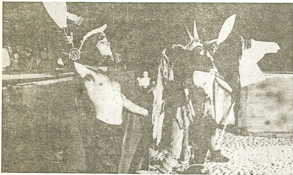
«La llanada solitaria» es una historia de pasiones y amarguras.

El domingo, la plaza de los Fueros se convirtió en un verdadero lugar de encuentros. A las diez y media de la noche los vitorianos tenían una cita muy especial, nada más y nada menos que con su propia historia, versión P. Larrainzar-Denok. Media hora antes de comenzar el espectáculo, era materialmente imposible encontrar entre el bosque de cabezas el más pequeño resquicio por el que poder divisar el escenario.