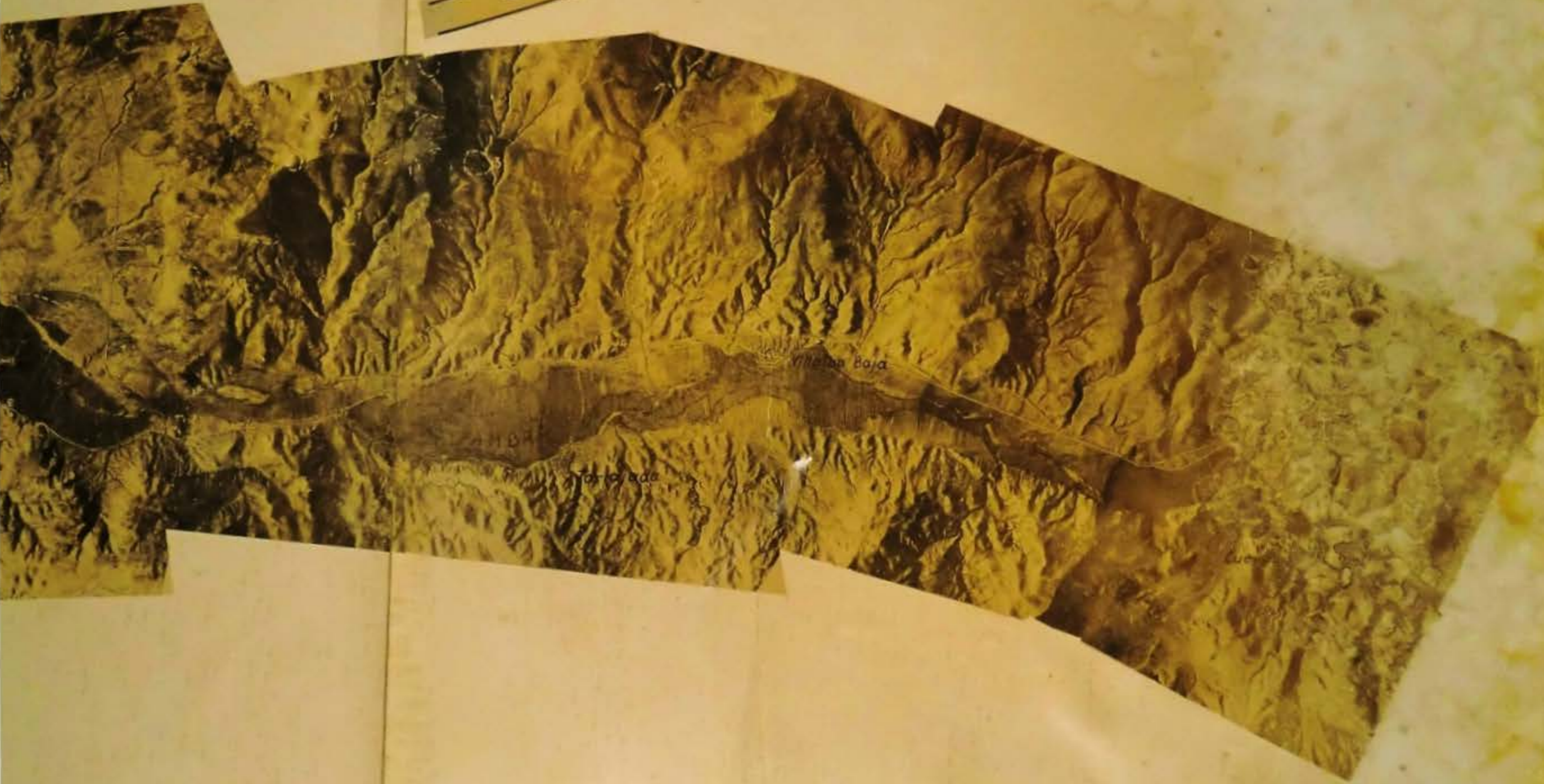
AIRETIKO ARGAZKIAK FOTOGRAFÍAS AEREAS